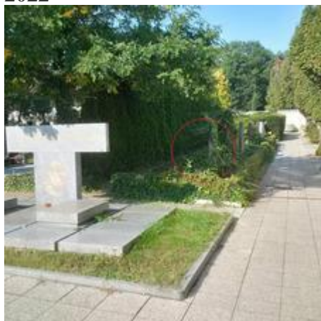
Nové místo pro NSP za Pomníkem Sokolům