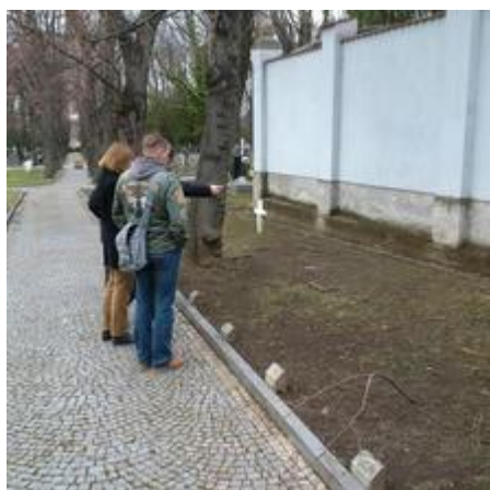
Místo u obvodové zdi na Olšanských hřbitovech

Na dubnovém jednání Náčelnictva Kmene dospělých Junáka ve Žďáru nad Sázavou jsem ostatní členy seznámil se situací a neúspěšně žádal o převzetí záštity NKD nad obnovou památníku. Přiznávám, že to pro mne bylo zklamáním, neboť v tu chvíli nešlo o moc více, než deklaratorní přihlášení se nejpočetnějšího oldskautského společenství v naší zemi k odkazu památníku.