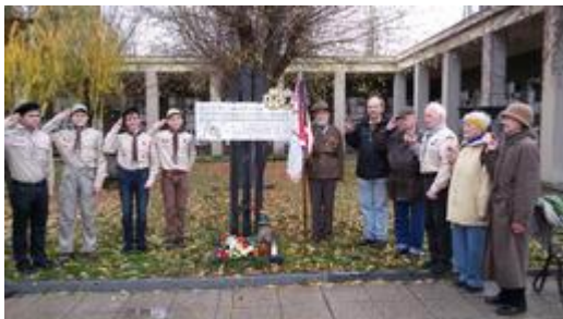
Z pietního setkání 17. listopadu 2015