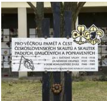
Detail desky NSP