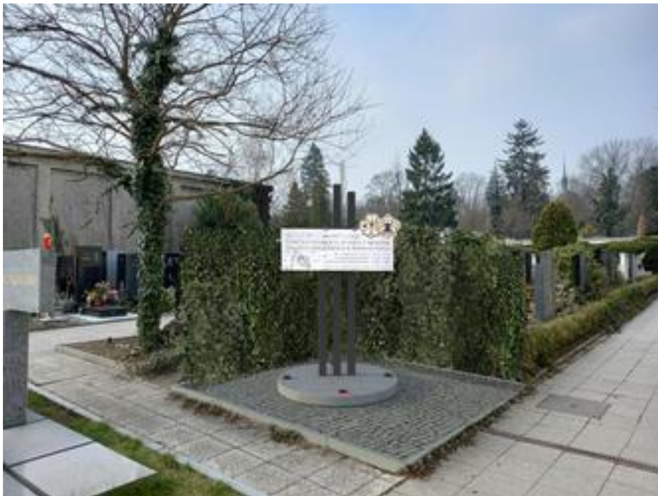
Vizualizace obnoveného Národního skautského památníku | architektonická studie