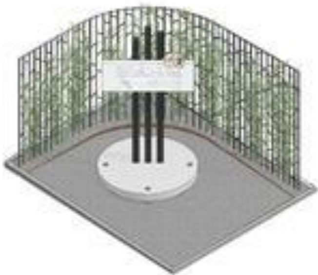
Axonometrie obnoveného NSP

Během intenzivních letních jednání s architekty obou stran se nám podařilo navrátit se k variantě téměř bezúdržbové – s povrchem z prorostlé štípané žulové dlažby 40 × 40 mm a se spárami šířky 15 mm (pro uchycení mechu) s tím, že bude dostačovat předložení upravené studie!