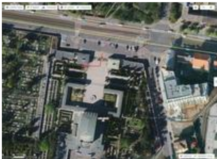
V areálu Krematoria Strašnice