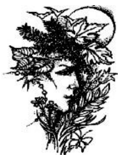
Grafika br. Šamana

Klub KD „38 Ječná“ Praha 2 v součinnosti s Pražskou družinou Svojsíkova oddílu zvou sestry i bratry na setkání na Jitsi Meet v sobotu dne 24. února 2024.